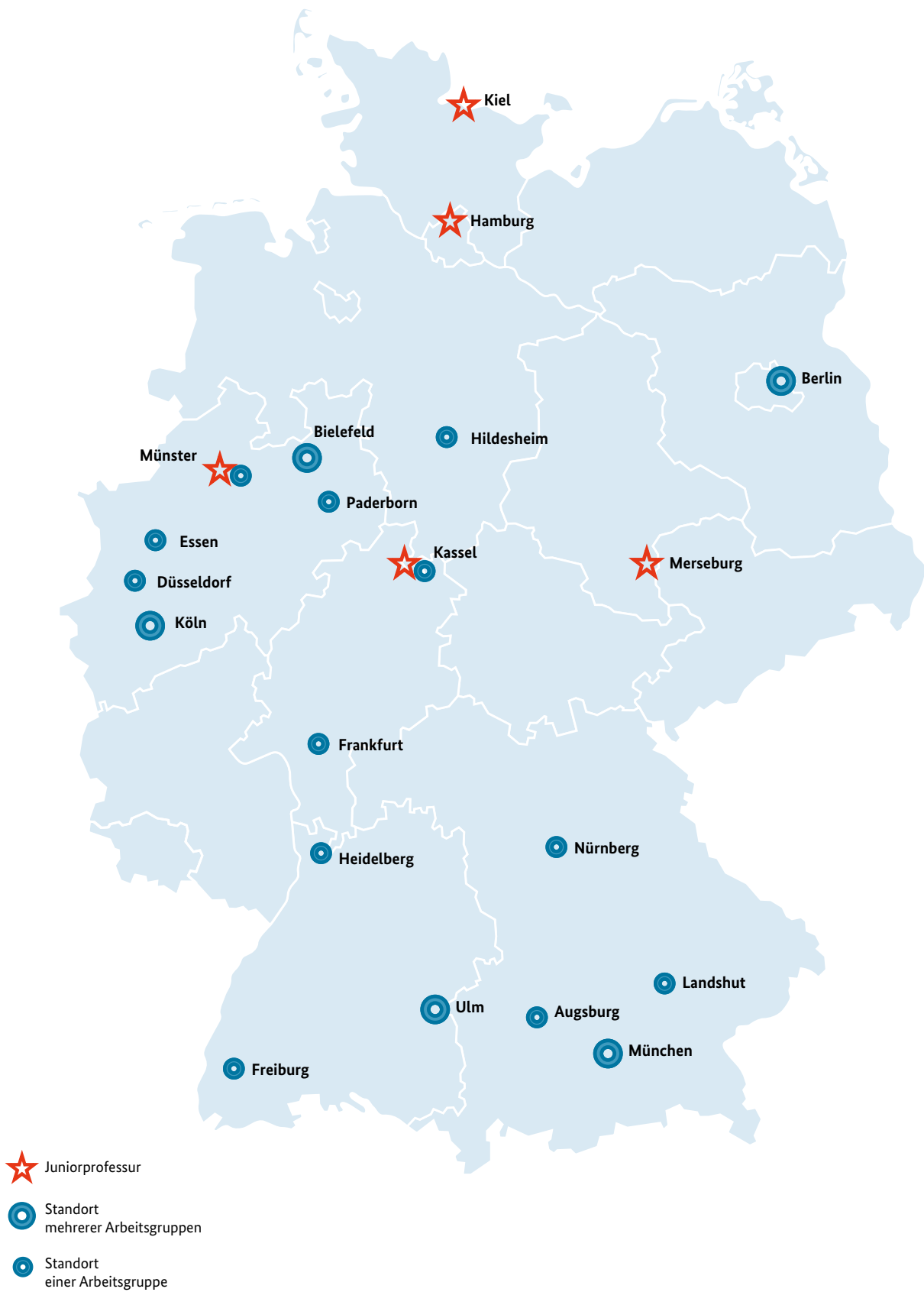
Standorte des Forschungsnetzes „Sexuelle Gewalt gegen Kinder und Jugendliche in pädagogischen Kontexten“