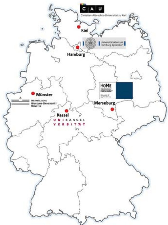
Standorte der Juniorprofessuren

Die fünf Juniorprofessuren decken mit den bei ihnen angesiedelten Forschungsprojekten einen weit aufgespannten Bereich im Themenspektrum Grenzverletzungen und sexualisierte Gewalt ab. Sie nehmen zudem ihre Verantwortung ernst, die Verstetigung der Forschung und Lehre zum Thema sexuelle Gewalt an ihren Hochschulen und darüber hinaus voranzubringen. Die Juniorprofessuren und die von ihnen verfolgten Forschungsprojekte im Überblick: