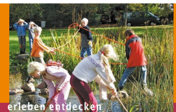
erleben entdecken erforschen erfinden