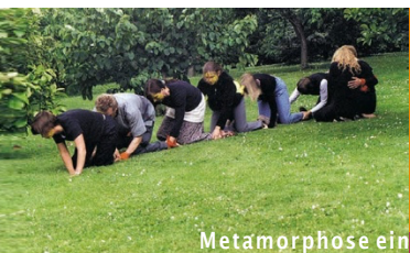
Metamorphose eines Schmetterlings